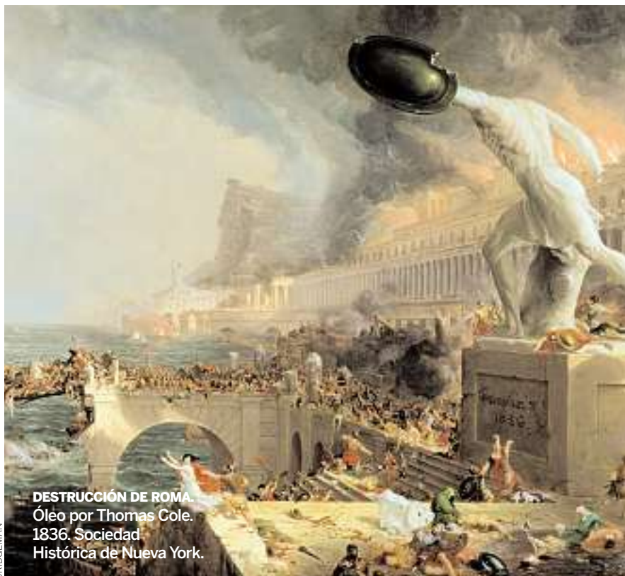
DESTRUCCIÓN DE ROMA. Óleo por Thomas Cole. 1836. Sociedad Histórica de Nueva York.